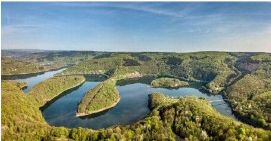
Figuur 3. De Urftsee