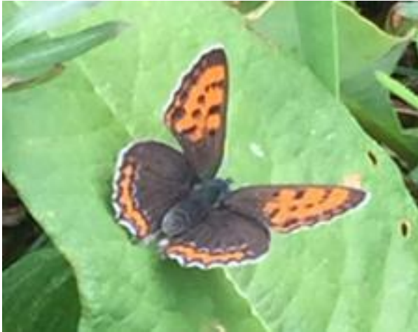
Figuur 3. Blauwe vuurvlinder ( Lycaena helle )