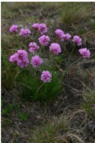
Figuur 2. Engels gras ( Armeria maritima ) op de Breinigerberg